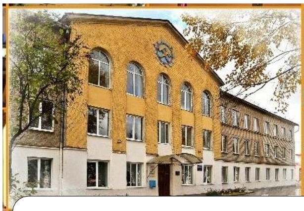
Кировский индустриально-педагогический колледж им. А.П.Чурилина