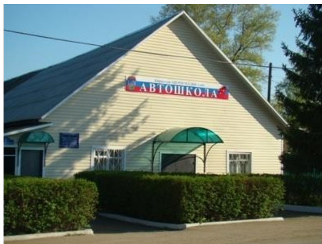
Кировская автошкола ДОСААФ