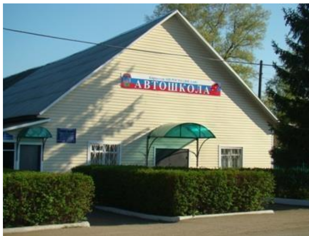
Кировская автошкола ДОСААФ

Сеть учреждений профессионального образования и самоопределения