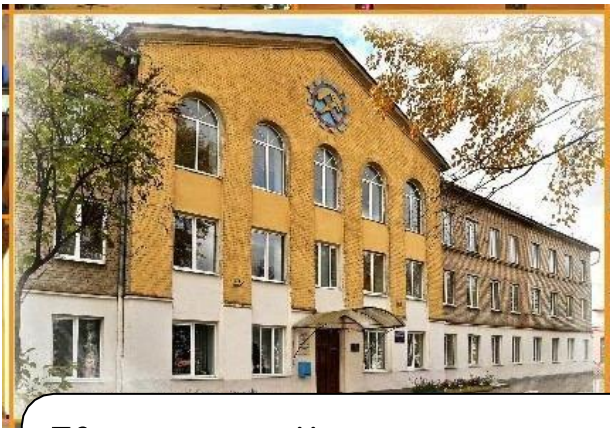
Кировский индустриально-педагогический колледж им. А.П.Чурилина